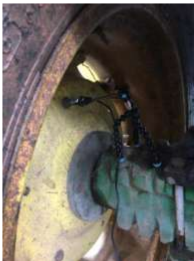
Figura 2. Localização do sensor indutivo no eixo traseiro do trator