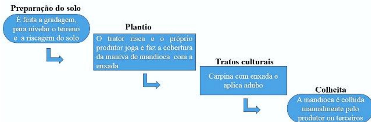
Figura 1 - Processo de Cultivo da Mandioca no Assentamento Carlos Marighella. Org. OLIVEIRA. I. Dados coletados em trabalho de campo, 2021

No que diz respeito ao gênero, dos 10 (dez) participantes da pesquisa, a maioria é do sexo feminino, 6 (seis). No que se refere à naturalidade dos participantes das entrevistas, a metade, ou seja, 5 (cinco) são do estado de Mato Grosso, sendo que 3 (três) são da cidade de Rondonópolis. Com relação a religião dos entrevistados, a maioria absoluta, 6 (seis), declararam que são seguidores da religião evangélica e outros 4 (quatro) responderam que são católicos.