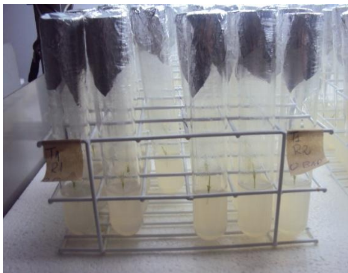
Figura 2. Segmentos nodais de cravo (explantes) obtidas in vitro e utilizadas na indução de multibrotações.

Araújo et al. (2004), em trabalho desenvolvido com gloxínia, obtiveram 3,5 brotos por explante ao utilizarem 2,25 mg/L de BAP em meio MS contendo 50% de sais. Este número é menor que o obtido no presente estudo. Supõe-se que, este resultado tenha sido talvez, influenciado pela concentração dos sais minerais e pela espécie estudada.