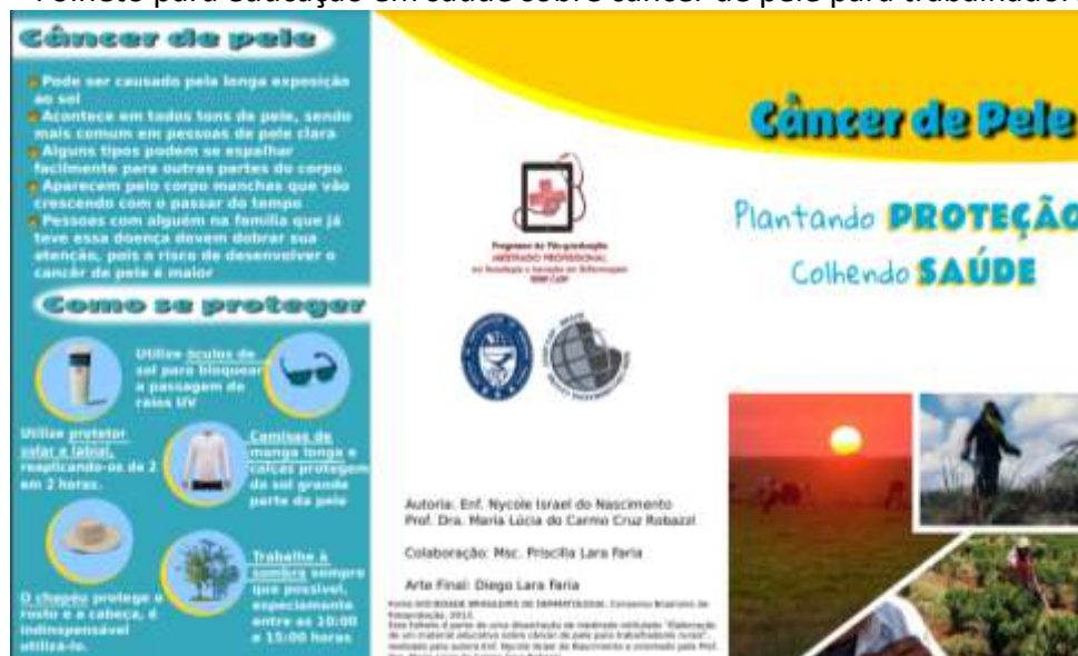
Figura 1 – Folheto para educação em saúde sobre câncer de pele para trabalhadores rurais.

É constatado que uma parte considerável desses indivíduos possuem um baixo nível de alfabetização, causando assim certa exclusão quanto ao acesso a informações sobre a prevenção de doenças. A criação de materiais educativos como estes da Figura 1 e Figura 2, que promovem informações sobre saúde, possibilitam o acesso de certos grupos, como os trabalhadores rurais, de se informar sobre a prevenção do câncer de pele, levando a redução de possíveis novos casos que possam surgir, esses materiais auxiliam também os profissionais da saúde facilitando o repasse de informações de forma mais rápida e fácil para os usuários (NASCIMENTO et al., 2018). A implementação da educação em saúde deve ser realizada por profissionais que consigam transmitir conhecimento para todo tipo de público e possuam treinamento relacionados a temática, sendo capacitados para causar mudanças positivas na saúde desses indivíduos. O controle do câncer de pele deve ser uma atividade essencial prestada a comunidade, tendo em vista o grande número de casos e a falta de recursos necessários para o diagnóstico precoce, tratamento e acompanhamento adequado (JÚNIOR et al., 2019).