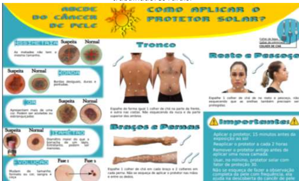
Figura 2 – Produção de folheto para educação em saúde sobre câncer de pele para trabalhadores rurais.